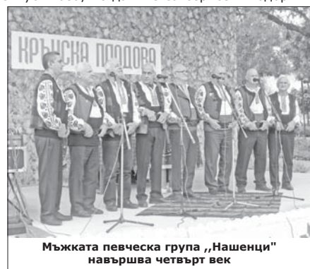
Мъжката певческа група „Нашенци“ навършва четвърт век