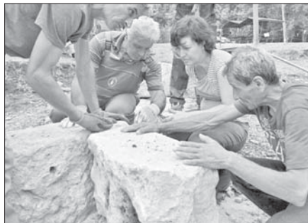
По време на дейностите в гетската столица Хелис

Значи образованието някъде бърка, щом днес зрели хора отричат, например, понятието гръцко изкуство