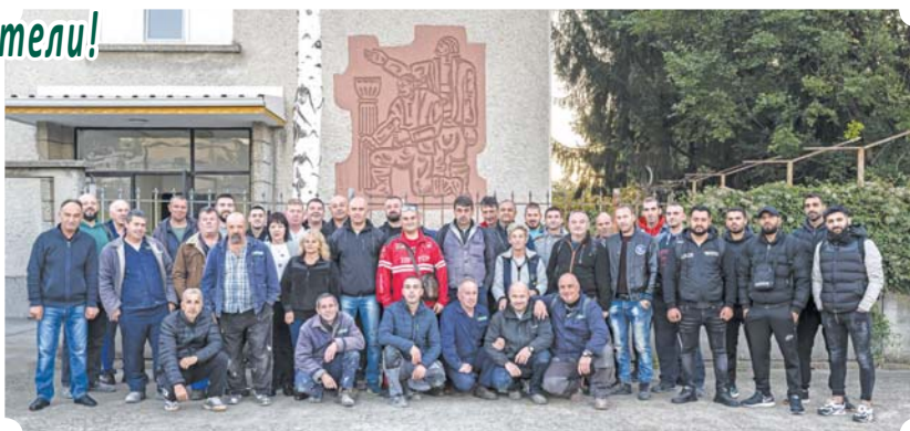
Колективът на Строително-ремонтния цех на „Арсенал“, 2024

На Димитровден празнуват всички в сферата на строителството – архитекти, инженери, проектанти, майстори, работници, които следват традициите на първите и градят с ум, знания, опит и умения не само настоящето, но и бъдещето!