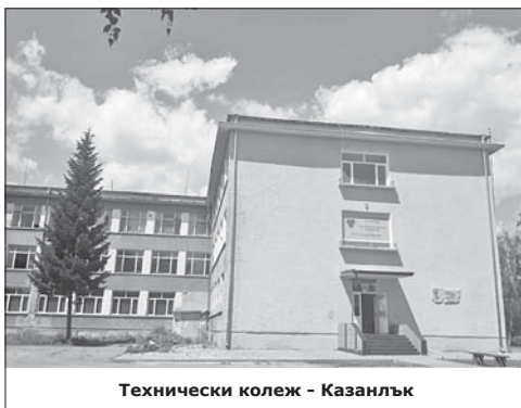
Технически колеж - Казанлък