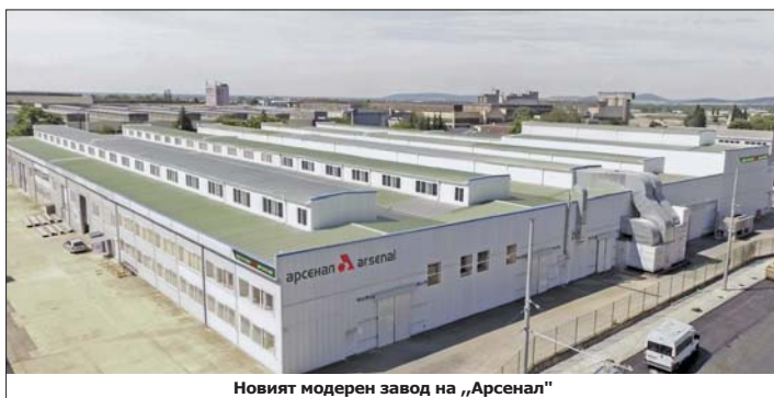
Новият модерен завод на „Арсенал“

На 25 октомври 2024 година „Арсенал“ АД – Казанлък, открива нов, модерен завод на територията на Стара Загора. Основното оборудване в него са машини с ЦПУ, автоматизирани с роботи и манипулатори. Производството в новата структура на дружеството, намираща се в областния град, е предназначено за специалната продукция на „Арсенал“ и е напълно безопасно. Събитието е част от мащабните дей-