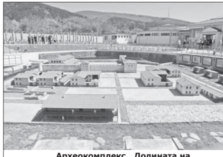
Археологически комплекс „Долината на тракийските царе“