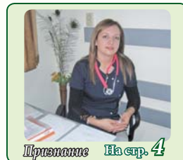
Преземане На стр. 4

25 октомври 2024 г. • година XIV • брой 339