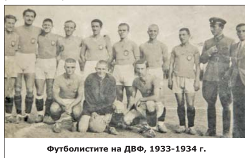
Футболистите на ДВФ, 1933-1934 г.

„През 1949 г. към Министерството на машиностроенето бе създадено Управление 7, в което влизаша няколко завода, сред които, под името Завод 21,