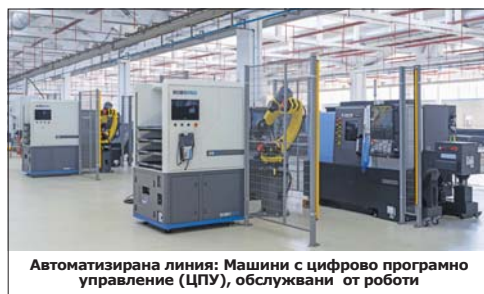
Автоматизирана линия: Машини с цифрово програмно управление (ЦПУ), обслужвани от роботи

На 25 октомври 2024 година „Арсенал“ АД – Казанлък, открива нов, модерен завод на територията на Стара Загора. Основното оборудване в него са машини с ЦПУ, автоматизирани с роботи и манипулатори. Производството в новата структура на дружеството, намираща се в областния град, е предназначено за специалната продукция на „Арсенал“ и е напълно безопасно. Събитието е част от мащабните дей-