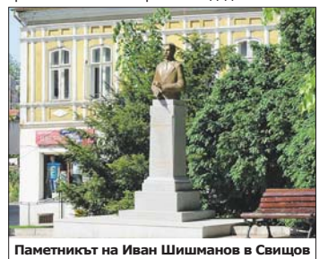
Паметникът на Иван Шишманов в Свищов

Лидия била съспанана, три месеца лежала парализирана. Спасило я едно писмо, което съпругът ѝ написал две години по-рано. В него той я молел да подреди книжния му архив, който бил огромен – много лекции, недовършено съчинение за Шекспир, недописана книга за Вазов, фолклорни изследвания, мемоарите му от Украйна, над 3000 епиграми, собствени и събирани. Благодарение на Лидия Шишманова посмъртно са издадени някои от