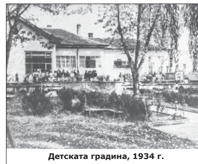
Детската градина, 1934 г.

Детската градина се посещава от 180 деца. Единствено тук в целия регион всяка група е в отделна сграда. Има разкрит филиал и в с. Горно Черковище. Младият и ам-