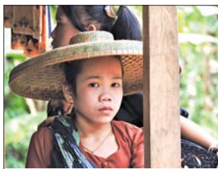
Момиче от външните бадуи

Батек са последните номади и ловци събирачи на Малайзия. Те наброяват едва 2000 души,