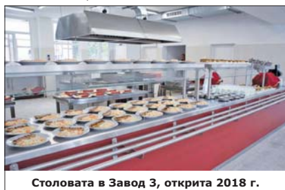
Столвата в Завод 3, открита 2018 г.

Поевтиняването на храната в 9-те напълно обновени фирмени стола е с 65% . Менюто е разнообразно, изготвя се по специален рецептурник за здравословно хранене. Централният стол работи и като кухня-майка, извършва и кетърингова дейност. В работническите столове е въведена