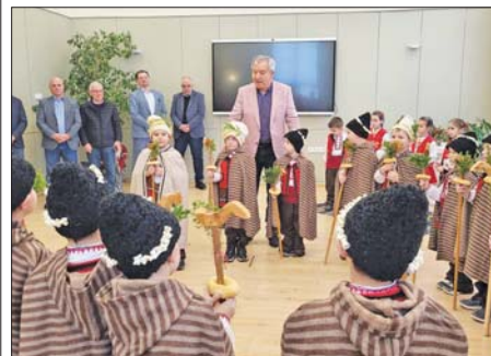
Коледен поздрав от малките буратинчета, 2023 г.

бициозен педагогически колектив е изцяло отдаден на своите възпитаници, за да бъдат родителите им спокойни на работните си места. А децата радват арсеналци със своите трогателни инициативи за Коледа, Баба Марта, Лазаровден, Великден и за Празника на „Арсенал“.