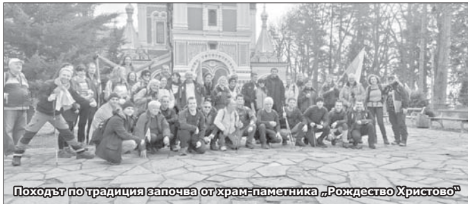
Походът по традиция започва от храм-паметника „Рождество Христово“

който от години тръгва от Царската чешма в Казанлък, съпътствайки похода с бягане по асфалтовото шосе към върха с развят български трибагеник в ръка, новата традиция се следва от 1993 г. Тогава неговият „Клуб 15“ стартира първо със зимните