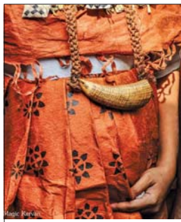
Фиджийска сватбена премяна, остров Вити Леву

се променили оттогава. По тъмните брегове, обрасли с джунгла и блатни гори, не се виждаше и светлинка. В тази част на река-