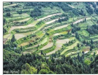
Оризища, провинция Гуйджоу, Южен Китай

Жителите на остров Малайта изработват местната валута от миди. За да си купят жена, соломононите трябва да заплатят голям брой нанизиди от мидени пари. Всеки клан има тотемно