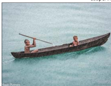
Момченца с издълбано от един ствол дървено кану, Соломонови острови

подобяващи крокодилска кожа. Крокодилът е свещено животно по Сепик, но се лови и за храна. „Чувствахме се като пътешественици отпреди 100 години, в някои отношения малко неща са