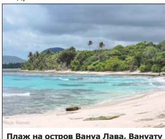
Плаж на остров Вануа Лава, Вануату

регион в Западна Ява и се делят на външни и вътрешни. Външните са около 10 хиляди души. Селищата им са 22 и са около и навътре в планината, като имат досег с цивилизацията. Външните бадуи служат като бариера срещу външни хора, които биха могли да навлязат в свещените вътрешни територии. Вътрешните бадуи живеят на 3-5 часа вървене навътре в джунглата, обитават 3 села и наброяват към 400 души. Кастово са по-висши, живеят изолирано от останалия свят и се придържат към древния си кодекс. Заради характерната бяла риза и бял тюрбан се наричат „бели бадуи“, докато външните са „черни бадуи“, защото се обличат в черно и индигово.