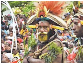
Воин с пера - Папуа Нова Гвинея

Растението ориз е култивирано за първи път в Китай преди 8200-13 500 години. То е културата, най-широко консумирана като основна храна в света. В Китай вместо „Как си?“ за поздрав, хората се питат „Изяде ли си ориза днес?“. Етническите групи в Южен Китай са