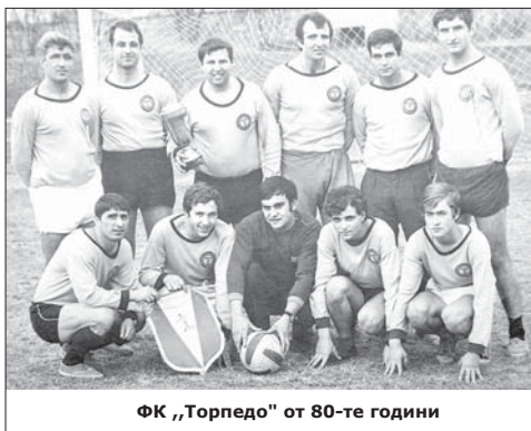
ФК „Торпедо“ от 80-те години

ните купи на национални спартакиади, регионални и други първенства. Арсеналци във футбол поддържат добър тим, който носи различни имена, но най-големите успехи са на отбор „Торпедо“, който играе доста години и в „Б“ футболна група. През 1989 г. тимът на дружеството