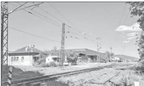
Ако се реши въпросът с терена, новата автогара ще се намира в района около ж.п. гарата в Казанлък

криване на тръжна процедура до директора на „Железопътна секция – Пловдив“, но до момента такава не е открита, поради което все още не е