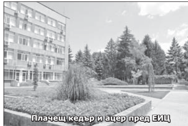
Плачещ кедр и ацер пред ЕИЦ

които е в парка пред ЕИЦ. Тук тъмночервени листа разперва и елегантният ацер. В комбинация с обновения шадраван пространството си е истински релаксиращо място. Другият