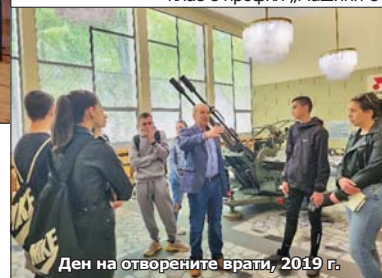
Ден на отворените врати, 2019 г.

цификации и други документи; извършва се паралелна проверка в ERP-система Технокол – на конструкторската и технологичната документация.