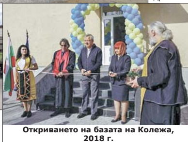
Откриването на базата на Колежа, 2018 г.