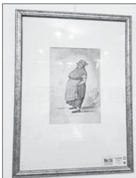
Картината „Клюкарката“ има два оригинала, но Чудомир е избрал този за лице