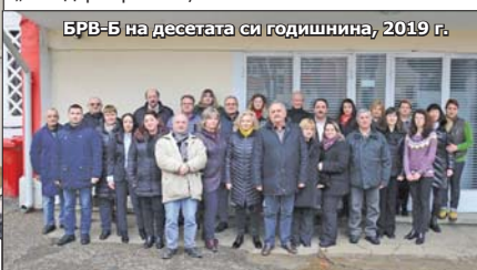
БРВ-Б на десетата си годишнина, 2019 г.