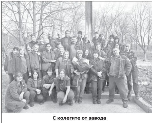
С колегите от завода

ме грешки. Повечето работещи тук знаят това и не си позволяват семейните проблеми да влияят на работата им. Тук