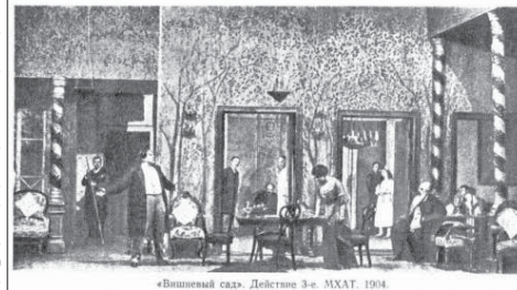
„Вишневият сад“. Действие 3-е. МХАТ. 1904

е издъхнал, си е намерила друг, с когото заминала за Европа. Но любовникът ѝ все бил болен, а когато оздравял, я ограбил и изоставил. Когато Любев се връща в Русия, получава от него телеграма, че иска да се съберат.