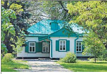
Родната къща на Чехов

В МХАТ. В прочутия Московски художествен театър, в който пиесите на Чехов „Чайка“, „Вуйчо Ваня“ и „Три сестри“ вече били поставени, очаквали новата пиеса с особено нетърпение. На 14 октомври 1903 г. тя била готова. Първ я получил Станиславски. За разлика от автора, той не смятал, че творбата е комедия. Подготовката на спектакъла се оказала сложна – заради различия прочит на сюжета. Чехов обичал да присъства на репети-