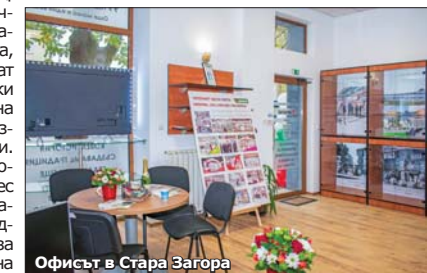
Офисът в Стара Загора