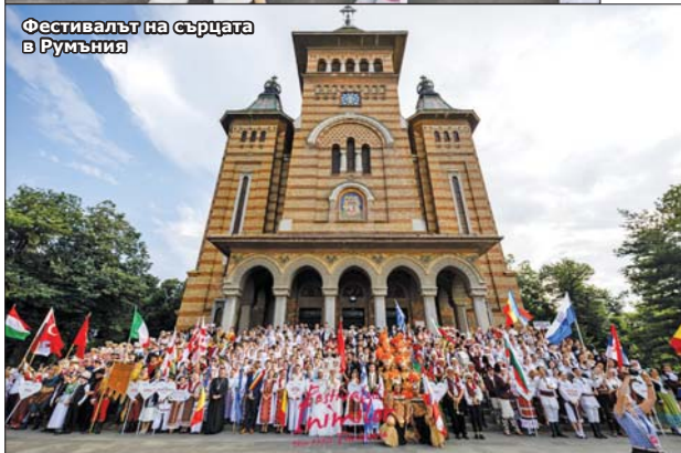
Фестивалът на сърцата в Румъния

Фолклорен ансамбъл „Арсенал“ представи България на Международния танцов фестивал, наречен Фестивал на сърцата, в румънския град Тимишоара. Събитието се организира в чест на революцията в Румъния, дала началото на демократичните промени в страната и се провежда всяка година от 1990-а до сега. Организатор е Домът на културата в Тимишоара. Фестивалът се е превърнал в едно от най-престижните културни събития в Тимишоара и Банат, в Румъния и Източна Европа. Провежда се по линия на СIOFF (Международен съвет за организация на фолклорни фестивали, асоцииран член на ЮНЕСКО).