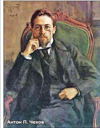
Антон П. Чехов

В деня на търга, с последните си пари, Раневская организира бал – с