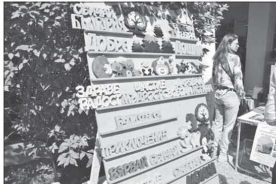
Част от посланията на 10-ия фестивал „Здравей, здраве!“ в Казанлък

- Посягат. Пробват, опитват какво ли не, особено младите, понякога това завършва фатално. Възрастните търсят алкохола най-често, но младите пробват и много по-опасни неща. Комбинират се и алкохол с