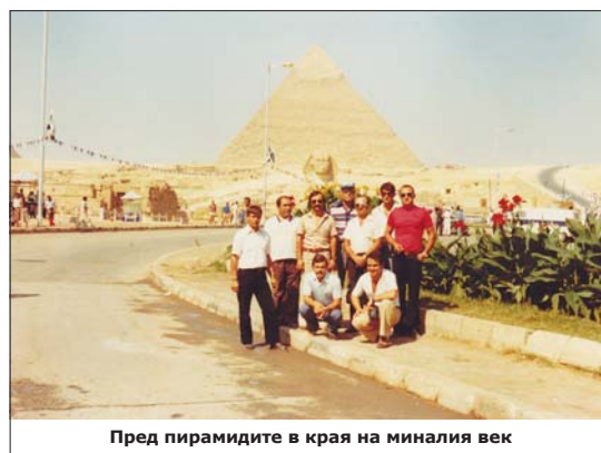
Пред пирамидите в края на миналия век