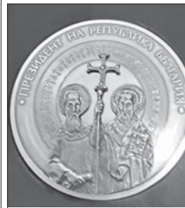
Плакетът от Президента

На 1 юни 1964 г. Национален парк-музей „Шипка“ и Национален парк „Бузлуджа“ са обединени в исторически и архитектурен резерват Национален парк-музей „Шипка-Бузлуджа“. По повод 60-ата му годишнина музеят бе удостоен от президента на Република България Румен Радев с почетен плакет „Св. Св. Кирил и Методий“. Поздравителен адрес до културния институт изпрати и генералният директор на „Арсенал“ инж. Николай Ибушев.