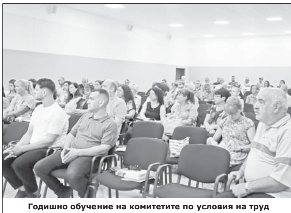
Годишно обучение на комитетите по условия на труд

ци на горните дихателни пътища са предимно сезонно зависими. Заболяванията на перифер-