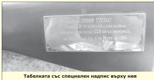
Табелката със специален надпис върху нея

По-късно Тодор Живков подарява пушката на казанлъшката оръжейница. Кубинският лидер никога не е