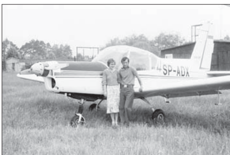
В полския град Радум по време на състезание

да помогне и изпраща писмо до казанлъшкия аероклуб. С майора остават приятели и след казармата, когато Петър срамежливо тръгва към аеробазата