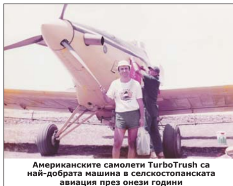
Американските самолети TurboTrush са най-добрата машина в селскостопанската авиация през онези години

По това време услугите на Селскостопанската авиация се