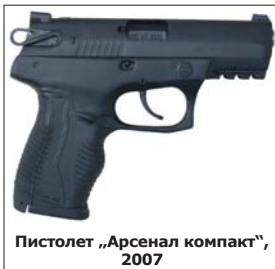
Пистолет „Арсенал компакт“, 2007

Предприятието проявява бърза адаптация към новите пазарни условия и преориентиране към струк-