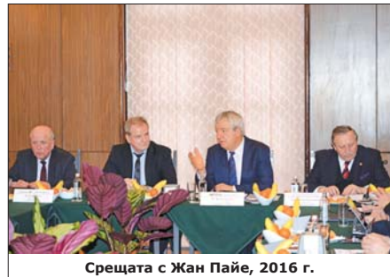
Срещата с Жан Пайе, 2016 г.

От 1999 г. всички оръжейни системи, произведени в „Арсенал“, са обект на интелектуална собственост и са регистрирани в Патентното ведомство