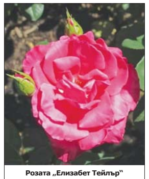
Розата „Елизабет Тейлър“

С Ричард и на небето. През 2008 г. филмовата легенда въвела всичките си дела в порядък и се простила с роднините си във Великобритания и САЩ. Съчинила си и епитафия: „Тук почива Елизабет Тейлър. Благодаря за всеки миг“. Искала да намери вечен покой до гроба на любимия си Ричард Бъртън в Швейцария, но това било невъзможно. Съпругата на Бъртън не можела да се примири с факта, че той обичал Елизабет до самия си край. В писмото му, което Тейлър пазела 27 години, актьорът признавал, че годините му с нея са били най-щастливите. Тогава актрисата настояла да я погребат до скъпия ѝ приятел Майкъл Джексън. „С Майкъл в земята, с Ричард на небето!“, повтаряла тя през последните си дни. През февруари 2011 г. претърпяла още една сърдечна операция.