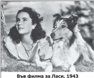
Във филма за Ласи, 1943

Филмовата кариера. „Аз търсех Бог, а намерих Елизабет Тейлър“, така Педро Алмодовар обобщава изявиите на филмовата дива – лице на холивудската студия „Метро-Голдуин-Майер“. Била висока само 1.57, но изключително красива. Нямала театрално образование, но се отличавала с необикновен талант, изразителност и интерпретаторско майсторство.