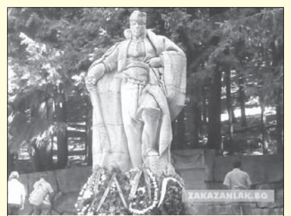
Паметникът на Хаджи Димитър

Национален парк „Бузлуджа“ – три исторически събития превръщат южния склон на връх Бузлуджа, днес Хаджи Димитър, в парк с 3 монумента. Това става през 1959 г. с министерско разпореждане. Първият паметник е издигнат на лобното място на войводата Хаджи Димитър, чиято чета е водила неравна борба с турската войска през юли 1868 г. Зад него е изградена стена от 28 каменни блока с имената на всички негови четници и родните им места. В основите й са положени костите на загиналите. Вторият е в чест на Учредителния конгрес на БСДП и се намира на мястото, където на 2 август 1891 г. се е състоял конгресът. Третият паметник е посветен на трима загинали партизани от Габровско-Севлиевишкия отряд. И трите паметника са открити на 2 август 1961 г.