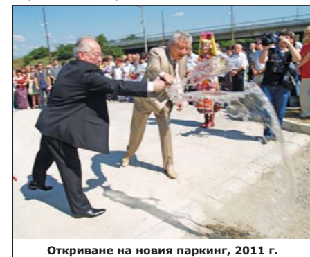
Откриване на новия паркинг, 2011 г.

Това е годината, в която започва безвъзвратното оздравяване на „Арсенал“.