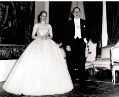
Ева Перон и Хуан Доминго

Госпожа Перон. Хуан Перон спечелил през 1946 г. надпреварата за президентския пост и, придружаван от съпругата си, предприел обиколка из цяла Аржентина.